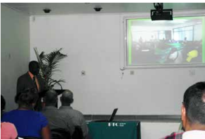
Opening masteropleiding in november 2013

In de afgelopen 16 jaren heeft het PTC 132 alumni afgeleverd. Behalve de eigen alumni zijn er ook bachelors afkomstig van ADEK die geen directe aansluiting vinden op vervolgonderwijs in Suriname. Om hieraan invulling te geven is het instituut aangevangen met de MBA in Innovation and Technology. De lector heeft sturing gegeven aan de opzet en realisatie van de MBA. Deze wordt verzorgd met ondersteuning van de TSM Business School. De opleiding is competentiegericht en levert een directe bijdrage aan de ontwikkeling van de student, de werkcontext van de student en de bredere maatschappelijke context. De opleiding is gestart met 15 studenten en duurt 18 maanden. Het diploma wordt afgegeven door de TSM Business School.