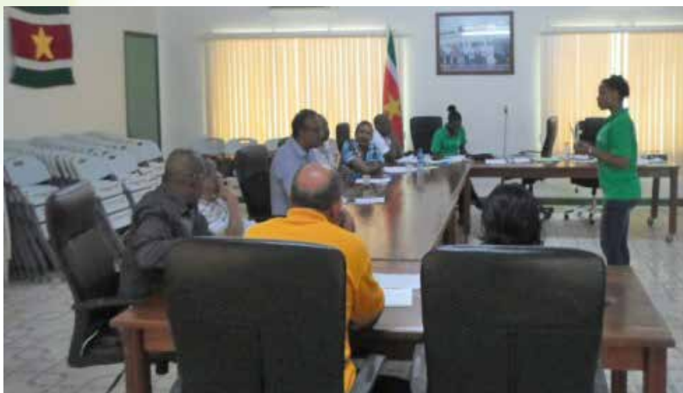
Werkbezoek te Nickerie

Op verzoek van de districtscommissaris van Nickerie, de heer Joeloemsingh, en de commissie Landbouwonderwijs onder leiding van de heer K. Donk zijn er gesprekken geweest met de verantwoordelijken van de agrarische sector in Nickerie. Het PTC is gestart met het identificeren van de competenties en bijbehorende skills voor een landbouwdeskundige. Het traject wordt In 2014 voortgezet waarna het curriculum aangeboden wordt aan minister A. Adhin van Onderwijs en deskundigen op het gebied van de agrarische sector in Paramaribo. Een behoefteonderzoek moet de feasibility van de technische hbo-opleidingen in het district in kaart brengen.